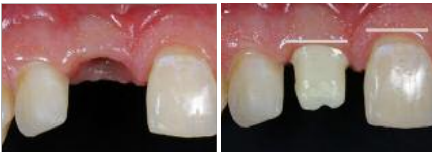
Abb. 3: Stabile Weichgewebssituation fünf Wochen nach der Eingliederung der laborgefertigten provisorischen Versorgung. – Abb. 4: Individuell gefertigtes Zirkonoxidabutment ohne ausreichende Berücksichtigung der benachbarten Weichgewebkontur. Der Präparationsrand liegt zwar nur leicht subgingival, die resultierende Kronenform wird aber nicht zum benachbarten Zahn passen.