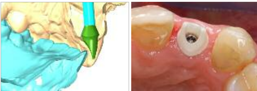
Abb. 1 und 2: Klinisches Anwendungsbeispiel für ein individuell gefertigtes Zirkonoxidabutment zur Versorgung eines Einzelzahnimplantates (Atlantis, Astra, Tech Elz).

Gerade im Frontzahnbereich wird das ästhetische Ergebnis einer implantatprothetischen Versorgung stark durch die Gestaltung des Durchtrittsprofils und eine gute Ausformung der Weichgewebe beeinflusst. Eine definitive prothetische Versorgung sollte erst erfolgen, wenn nach der Freilegung eine vollständige Ausheilung des periimplantären Weichgewebes erreicht worden ist. Dies erfordert zumeist eine provisorische Versorgung über einen Zeitraum von vier bis sechs Wochen. Sobald sich stabile Weichgewebsverhältnisse eingestellt haben, kann mit der Abformung für die endgültige Versorgung begonnen werden (Abb. 3).