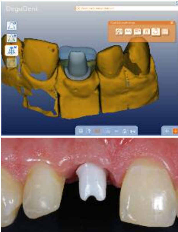
Abb. 5: Individuelles Design des Abutments mit Festlegung der Präparationsgrenze (Cercon Art, DeguDent GmbH, Hanau). – Abb. 6: Modifiziertes Design des Abutments mit tiefer liegender Präparationsgrenze, auf diese Weise wird eine Kronenform ermöglicht, die zur Kontur der Nachbarzähne passt.

Idealerweise wird mit dem Abutment eine leicht subgingivale Lage der Präparationsgrenze angestrebt. Eine tief subgingivale Positionierung der Präparationsgrenze hat den Nachteil, dass die spätere Entfernung von Zementresten erschwert wird. Andererseits ist beim Design des Abutments auch auf eine Harmonie der roten Ästhetik zu achten, die Weichgewebsausformung sollte also den Verlauf der benachbarten Zähne berücksichtigen. Wird dieser Aspekt vernachlässigt, entstehen bei der späteren Versorgung ein disharmonischer Verlauf der Weichgewebe und damit ein ästhetischer Kompromiss (Abb. 4).