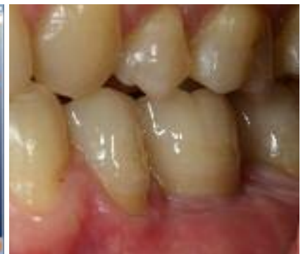
Abb. 9: CAD-Prozess für ein zweiteiliges Zirkonoxidabutment (Cerconart, DeguDent GmbH, Hanau. – Abb. 10: Lateralansicht der zementierten vollkeramischen Kronen. Das Durchtrittsprofil der Implantatsuprastruktur ist identisch mit einem natürlichen Zahn.