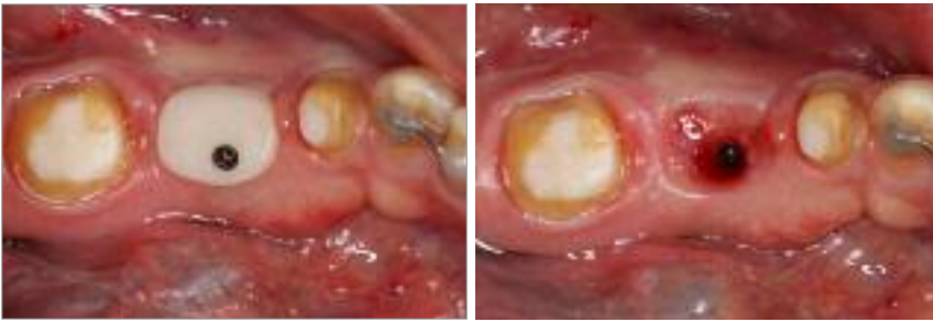
Abb. 7: Individuell gefertigte Heilungskappe. Für die Herstellung wird der Implantateinbringepfosten mit lichthärtendem Komposit ummantelt, bis ein rechteckiges bis ovalen Durchtrittsprofil erreicht wird. – Abb. 8: Weichgewebszustand zwei Wochen nach der Einbringung des individuellen Heilungsaufbaus.

bination von vollkeramischen Abutments und Vollkeramikronen tatsächlich eine Verbesserung des ästhetischen Behandlungsergebnisses erreicht wird. Jung et al. (2008) konnten nachweisen, dass dieser Effekt jedoch stark von der Dicke des periimplantären Weichgewebes abhängt. Sofern die Weichgewebsdicke weniger als 3 mm aufweist, lässt sich ein ästhetischer Vorteil von vollkeramischen Suprakonstruktionen nachweisen. Ist das periimplantäre Weichgewebe jedoch dicker als 3 mm, lassen sich sowohl mit metallgestützten als auch mit vollkeramischen Suprakonstruktionen gleichwertige Ergebnisse erzielen.